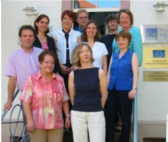
L'équipe de l'Euro-Institut - Das Team des Euro-Instituts